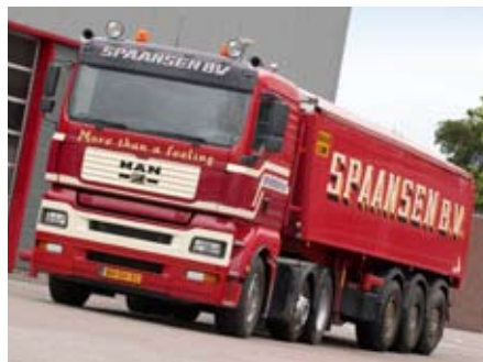
Spaansen verzorgt de logistiek