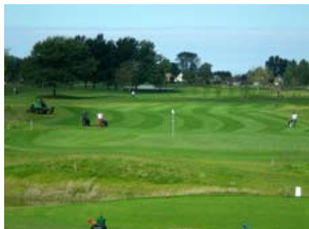
Golf & Countryclub Regthuys

De werkzaamheden bestaan uit het realiseren van een Golfbaan met een landschappelijk karakter met veel hoogteverschillen. Om dit te realiseren is 100.000 m 3 categorie-1 grond benodigd. De categorie-1 grond (conform het oude Bouwstoffenbesluit) kan tot einde werk worden geaccepteerd. De partijen grond dienen steekvast en met maximaal 3% puin te worden geleverd. Het is eventueel mogelijk om met niet aangedreven vrachtauto's (trailers) grond te leveren. Dit echter altijd in overleg.